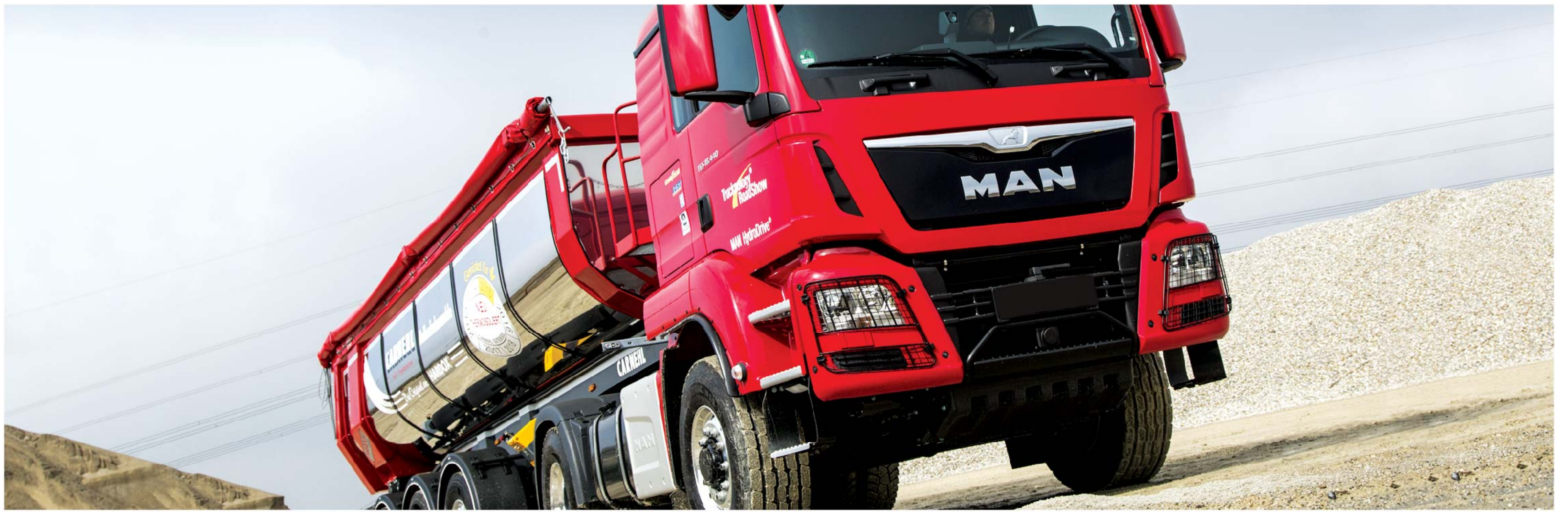
روغن موتورهای دیزلی