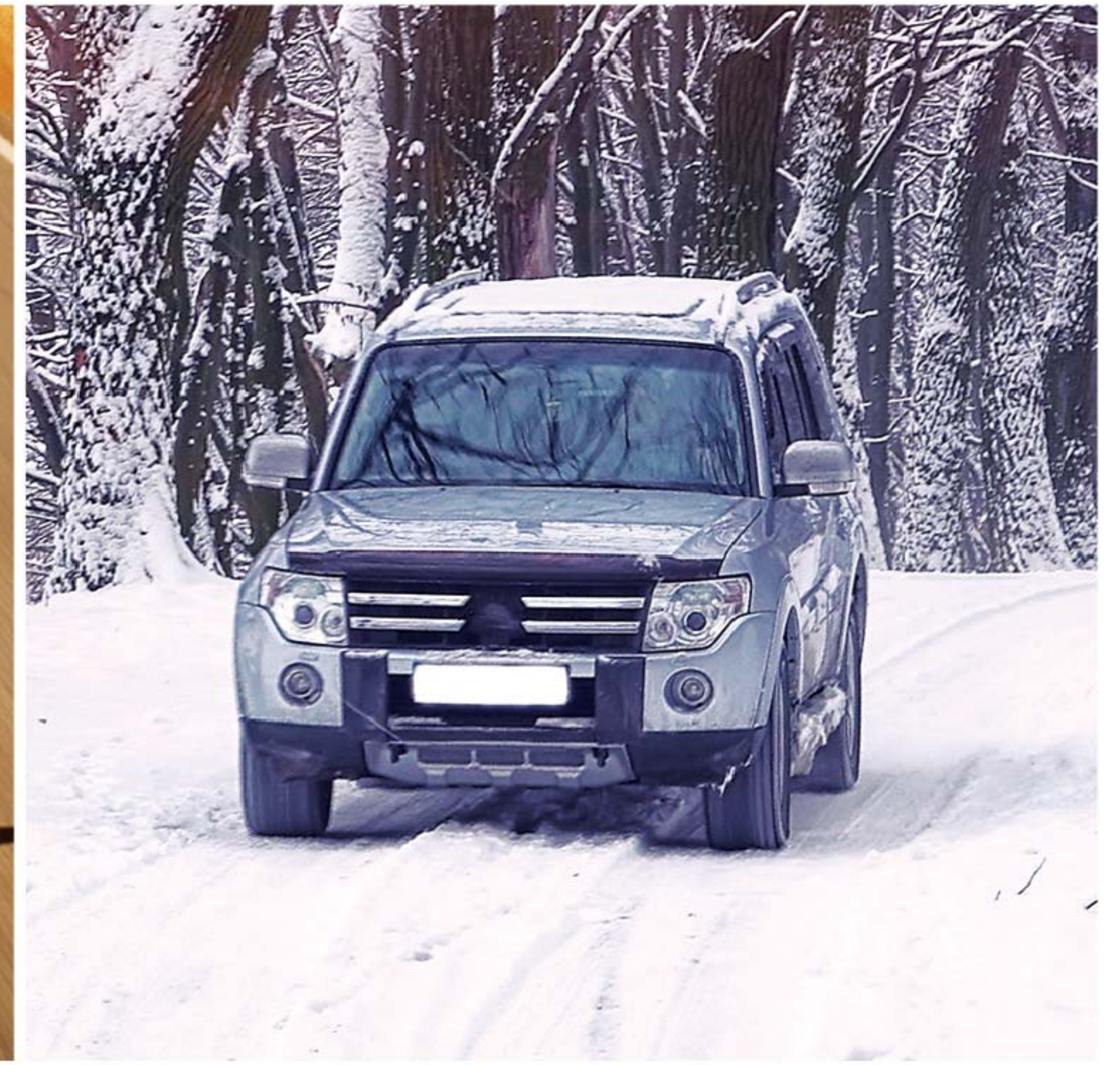
سیالات خنک کننده (ضدیخ، ضدجوش و ضدزنگ)