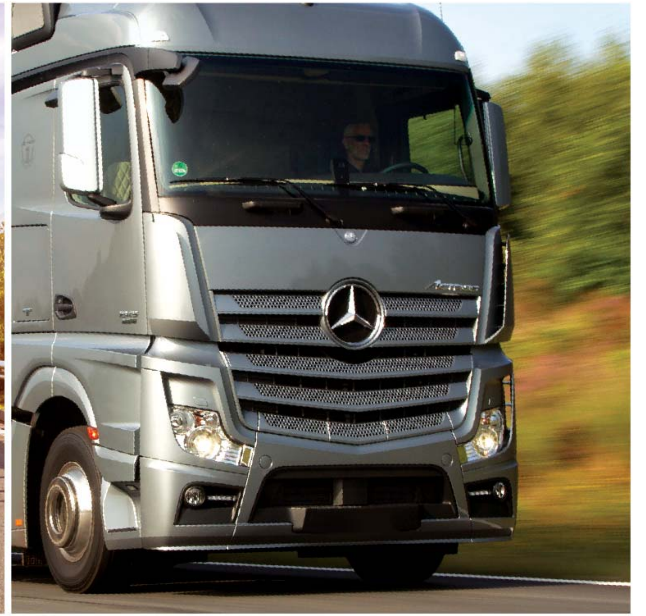
روغن موتورهای دیزلی